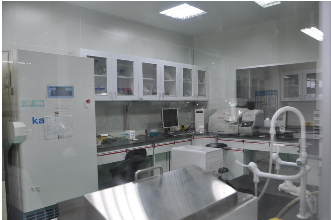
拉曼光譜實驗室(A426 室)