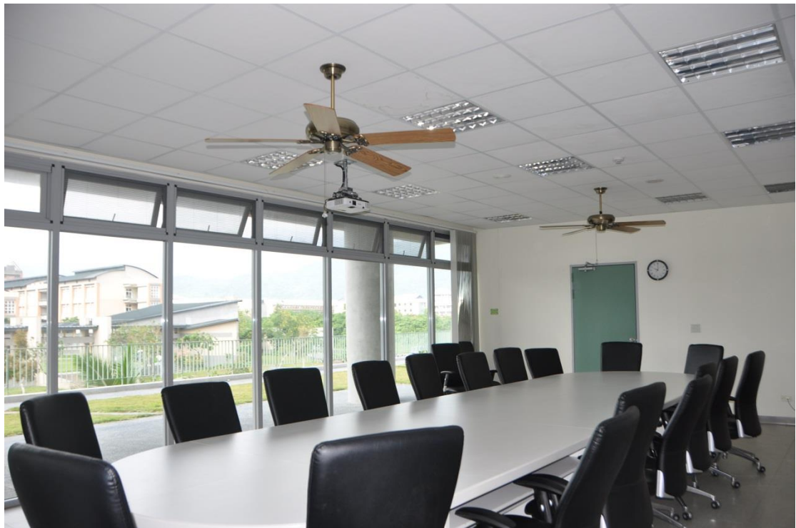
環境學院-大會議室(B216 室)